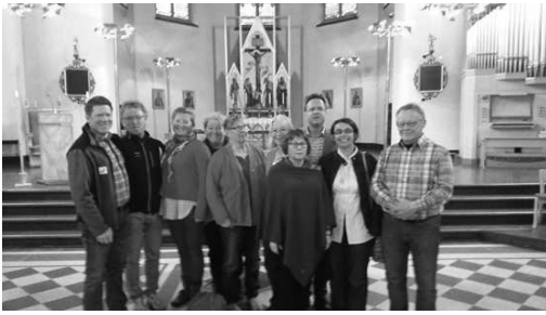
Kyrkorådet och personal på visit i Luleå i mitten på maj 2016. Bilden är tagen i Domkyrkan.