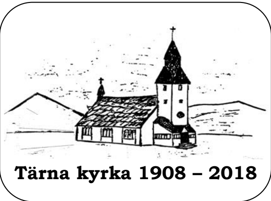
Tärna kyrka 1908 – 2018