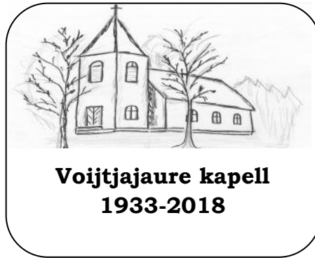
Voijtjajaure kapell 1933-2018