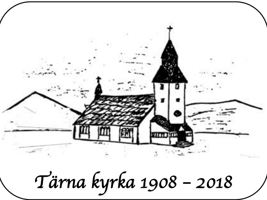
Tärna kyrka 1908 - 2018